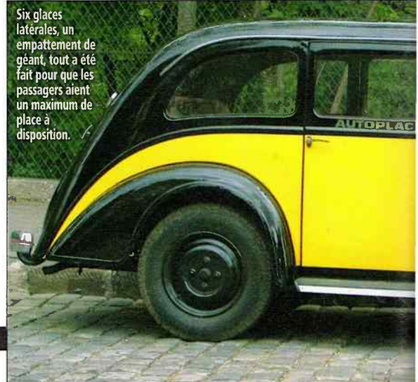
Six glaces latérales, un empattement de géant, tout a été fait pour que les passagers aient un maximum de place à disposition.

De part et d'autre du pare-brise, les deux lanternes ne sont pas simplement là pour l'esthétique. Elles permettaient d'identifier, de nuit, les taxis en circulation, le numéro d'immatriculation de la voiture étant