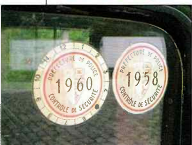
Ce taxi a obtenu sa dernière autorisation en mai 1960. A l'époque, ces contrôles avaient lieu tous les deux ans.

met sans doute d'accrocher son parapluie ou de mettre son imperméable pour éviter qu'il ne se froisse, deux panneaux qui préviennent qu'il ne faut pas fumer dans cette auto, ni cracher ! Dessous, deux strapontins pour accueillir d'éventuels passagers supplémentaires, et qui sont pour l'heure paisiblement repliés dans leur logement.