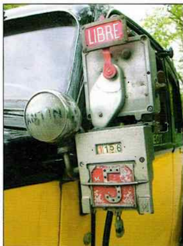
Ce n'est qu'en 1962 que le taximètre sera obligatoirement situé à l'intérieur du véhicule. Le petit drapeau qui indique que le taxi est libre étant alors remplacé par un signal lumineux sur le toit. Le chiffre 5 sur fond rouge indique ici le numéro du véhicule et permet l'identification de son chauffeur auquel était attribué une couleur.