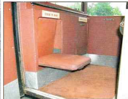
Deux petits strapontins montés sur ressorts permettent d'accueillir deux passagers supplémentaires à l'AR.