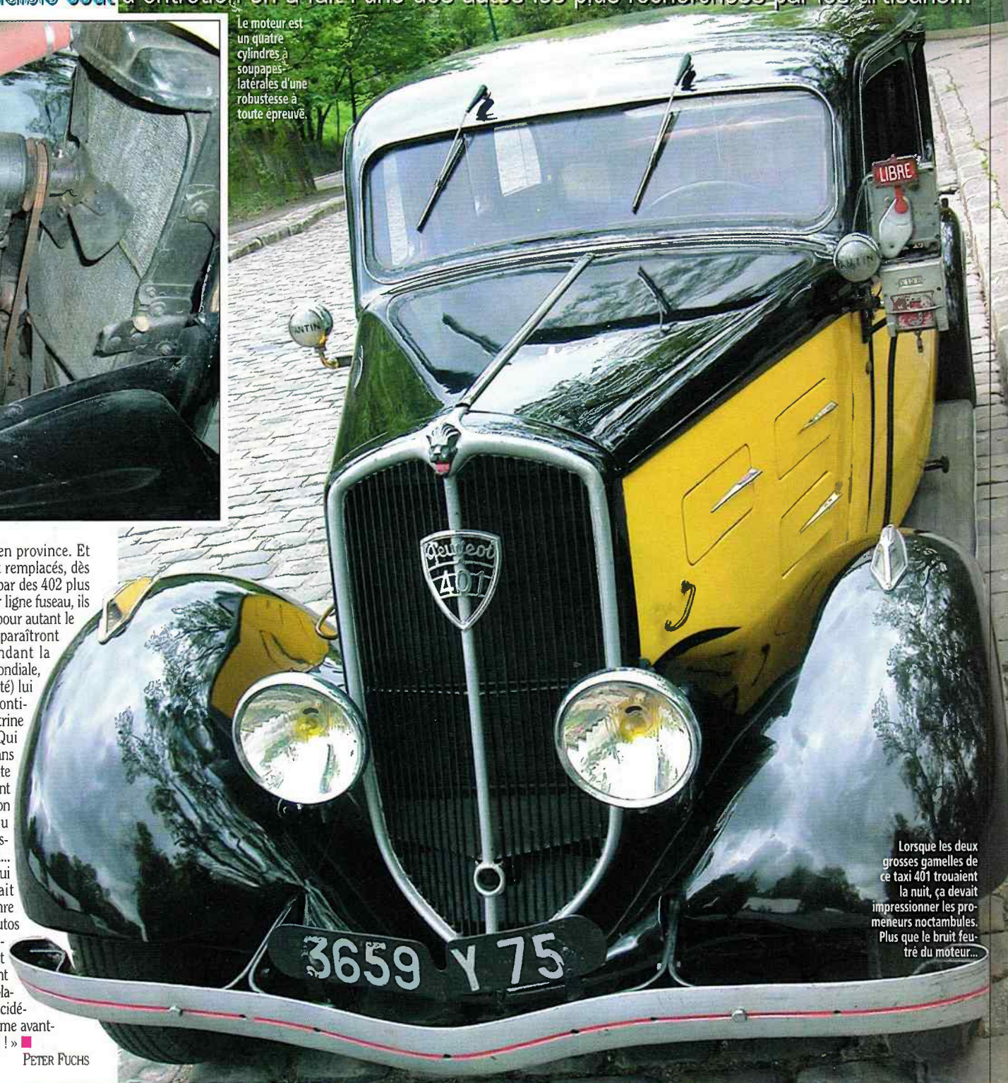
Lorsque les deux grosses gamelles de ce taxi 401 trouaient la nuit, ça devait impressionner les promeneurs noctambules. Plus que le bruit feutré du moteur...