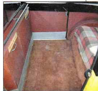
À l'AR, cinq passagers peuvent prendre place, mais on pouvait également y glisser un landeau !

ssible, et disposent d'une place maximale. Jusqu'à pouvoir glisser, à l'AR, un landeau !