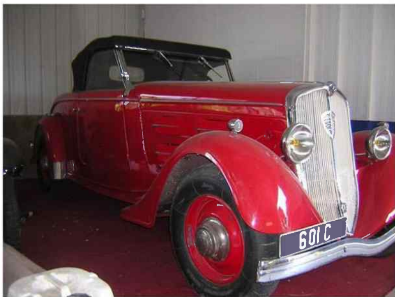
Le roadster 601C 1934