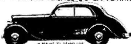
LA MÈRE ET SES GRANDS ENFANTS 2010 cm 3 28.500 FR.

"LA PEUGEOT 1934" EST, PAR SA SÉCURITÉ ET SON EXTRÊME AGRÉMENT DE CONDUITE, LA VOITURE IDÉALE DE LA FEMME